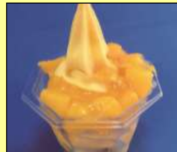
〈名護パイナップルパーク〉

常夏・鹿児島で生まれ育った濃厚で甘いマンゴーとフィリピン産マンゴーをブレンド。マンゴー特有の甘い香りが存分に引き出された贅沢ロールケーキ！