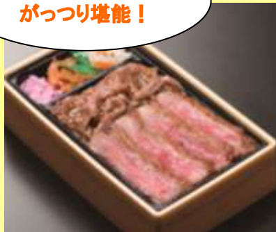
〈佐が家〉 佐賀牛サーロインステーキ &焼肉弁当 2,160 円