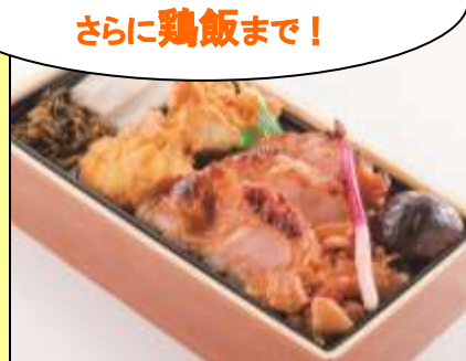
〈吉野とりめし保存会〉 大分とりづくし弁当 1,296 円 ※各日限定 30 個