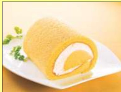
〈アンテレサントミルフィーユ〉

鹿児島名物、「むじゃき」の白熊。自家製ミルク・蜜・ふわとした雪の様な氷がほどよく絡み合い、口触り柔らか。今回特別にマンゴーバージョンが登場！