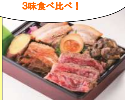
〈ダイニング萬来〉 黒づくし食べ比べ弁当 2,160 円 ※各日限定 30 個