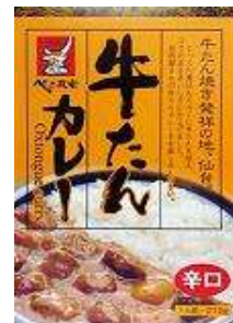
〈宮城〉牛たん カレー 561円