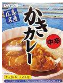
〈広島〉かきカレー 540円