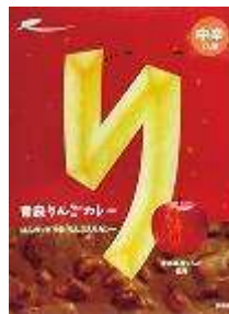
〈青森〉青森りんご カレー486円