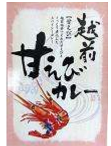
〈福井〉越前甘え びカレー 734円