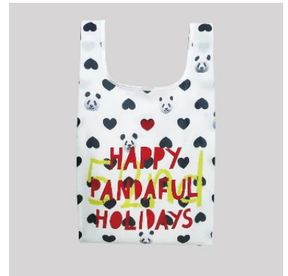
「バナーエコバッグ」 幅約32×高さ約55cm