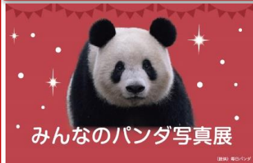
みんなのパンダ写真展