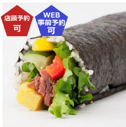
←〈ポール・ボキューズ〉ごま油香るローストビーフ恵方巻 (1本) 1,620 円 【販売期間：2/2(日)】 ※店頭ご予約承りは 1/31(金)まで