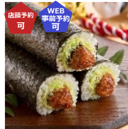
←〈まつおか〉味噌ヒレカツ恵方巻 (1本) 1,188 円 【販売期間：2/2(日)】 ※店頭ご予約承りは 1/31(金)まで