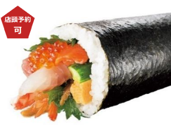
〈北辰館〉大漁極太巻 (1本) 3,080 円 【販売期間：2/1(土)、2(日)】 ※店頭ご予約承りは 1/31(金)まで