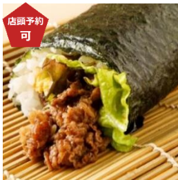
←〈黒毛家〉黒毛和牛たっぷり恵方巻 (1本) 1,296 円 【販売期間：2/2(日)】 ※店頭ご予約承りは 1/31(金)まで