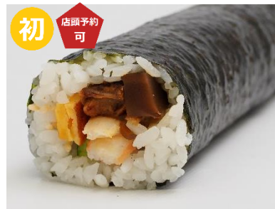
〈有職〉節分上巻 (1本) 1,944 円 【販売期間：2/1(土)、2(日)】 ※店頭ご予約承りは 1/31(金)まで