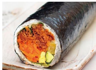
〈韓美膳 DELI〉和牛プルコギキンパ (1本) 1,188 円 【販売期間：2/2(日)】