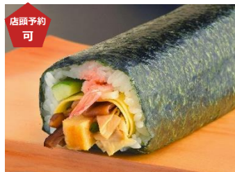
〈梅の花〉恵方寿司 (1本) 1,112 円 【販売期間：2/2(日)】 ※店頭ご予約承りは 1/31(金)まで