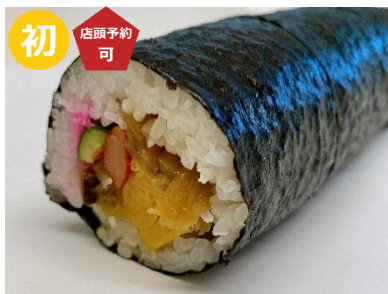
〈新潟ゆのたに心亭〉福巻すし (1本) 864 円 【販売期間：2/2(日)】 ※店頭ご予約承りは 1/31(金)まで