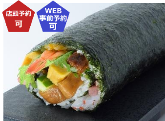
〈古市庵〉節分 13 種のうず潮巻 (1本) 1,674 円 【販売期間：2/1(土)、2(日)】 ※店頭ご予約承りは 1/31(金)まで