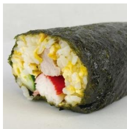
←〈赤坂飯店〉焼豚と焼飯の二重巻 (1本) 1,180 円 【販売期間：2/2(日)】