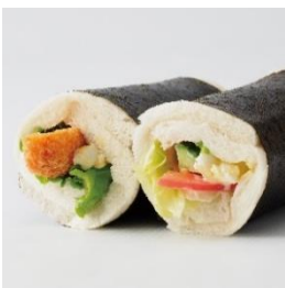
←〈アルサスローレン〉(左)海老カツ恵方巻サンド (1本) 780 円、(右)恵方巻サンド (1本) 680 円 【販売期間：2/1(土)、2(日) 各日・各 20 本限り】 ※店頭ご予約承りは 1/31(金)まで