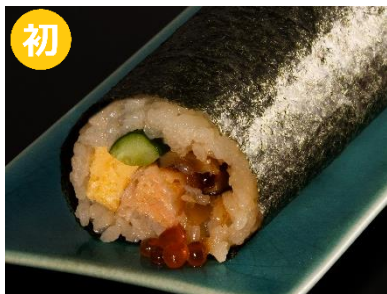
〈割烹 坊々樹〉米を楽しむ 贅沢のり弁巻き (1本) 1,620 円 【販売期間：2/1(土)、2(日)】