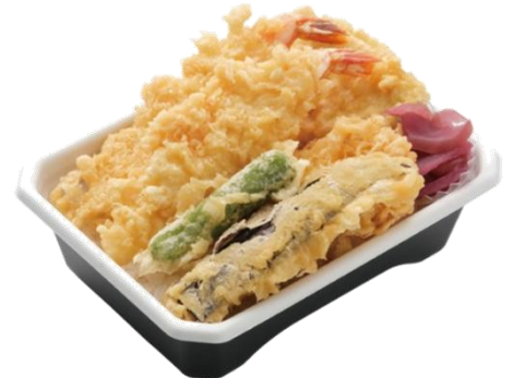
↑定番のえび、ほくほくのさつまいも、なすなどを乗せた、愛され続ける天丼です。〈銀座天一〉天丼弁当(竹) (1食)1,242円