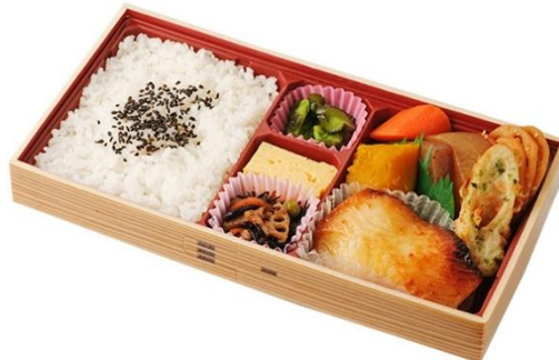
↑人気のやわらかいカラスカレイを自家製味噌ダレに漬けた上品な味わいのお弁当。〈まつおか〉カラスカレイの味噌漬焼き御膳 (1食)1,188円