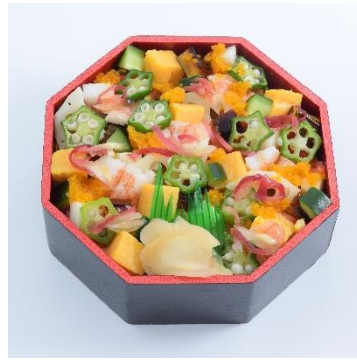
↑夏野菜を盛付けた、さっぱりとした味わいのちらし寿司。〈古市庵〉海老と季節野菜の夏ばら寿司 (1食)777円