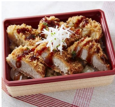
←人気の一口ひれカツとじゃがいもコロケを一緒にしました。北海道産の男爵いもと、玉ねぎなどの野菜の甘みを活かして、素材本来の風味を追求したコロケと、脂身が少なく、柔らかなヒレかつがポイント。〈神戸コロケ〉ひれ・コロ重 (1食)689円