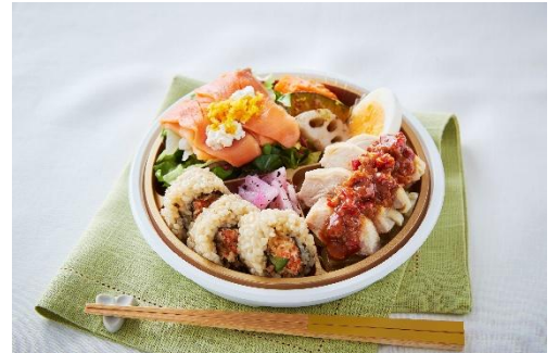
↑野菜の多彩な味わいが楽しめます。〈RF1〉スモークサーモンと蒸し鶏の美 Salad bento (1食)1,289円