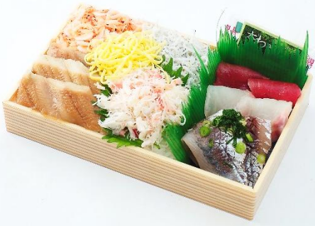
↑桜えびを始めとした、旬の食材と人気の海鮮入り。〈北辰館〉初夏の海鮮弁当 (1食)1,580円 ※5/13(水)→26(火)