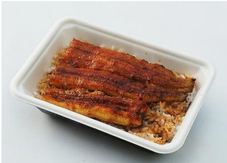
↑外はパリッと、中はふっくら仕上げた自慢のお弁当。〈銀座鳴門〉うなぎ弁当 (1食)3,726円