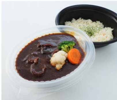
↑芳醇なデミグラスソースで煮込んだ肉厚牛タンシチュー。〈ポール・ボキューズ〉牛タンシチュー & バターライス (1食)1,080円