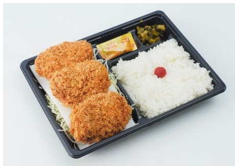
↑一口サイズで食べやすいヒレかつの弁当。〈井泉本店〉一口ヒレかつ弁当 (1食)1,098円