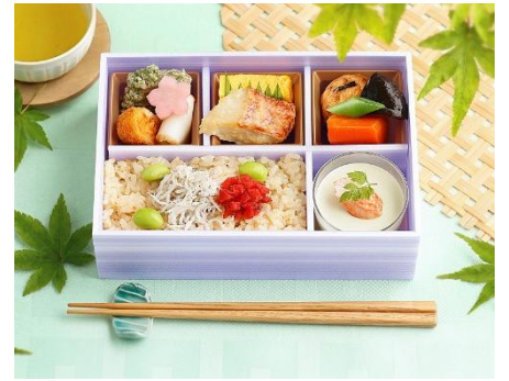
↑旨み溢れるしらす生姜御飯と枝豆スープ。〈日本料理 なた万〉初夏の涼味 (1食)1,890円 ※6/19(金)まで