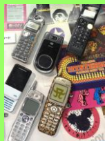
ポケベル・携帯電話