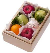
フルーツ 贈りたいもの ランキング5位 (ギャップ+2)