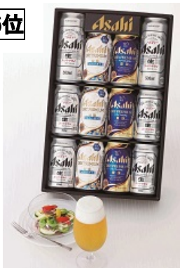
ビール 贈りたいもの ランキング2位 (ギャップ-4)