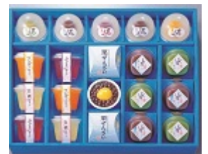
和菓子 贈りたいもの ランキング3位 (ギャップ-2)