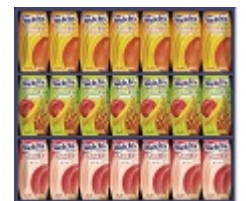
清涼飲料 (ジュース) 贈りたいもの ランキング9位 (ギャップ-1)