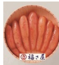
海産物 贈りたいもの ランキング8位 (ギャップ-1)