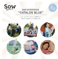
カタログギフト (グルメカタログ以外) 贈りたいもの ランキング15位 (ギャップ+7)