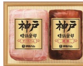
精肉・ハム 贈りたいもの ランキング4位 (ギャップ±0)