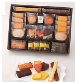
洋菓子 贈りたいもの ランキング1位 (ギャップ-1)