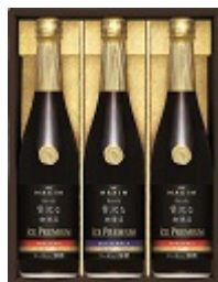
コーヒー・紅茶 贈りたいもの ランキング6位 (ギャップ-1)