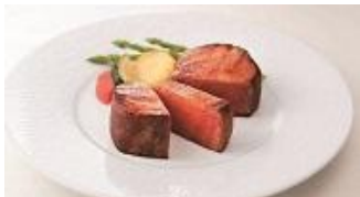
グルメギフトカタログ 贈りたいもの ランキング7位 (ギャップ+6)