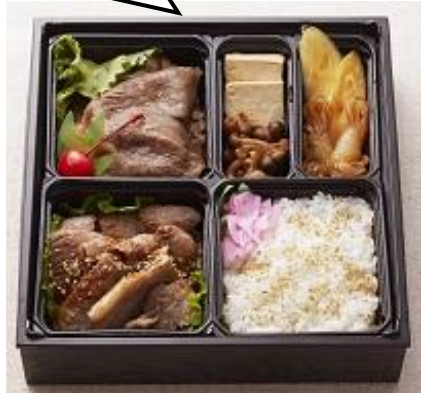
A5ランクの米沢牛のサーロインステーキとリブロースのすき焼きをセットに。〈味の梅ばち〉米沢牛豪華弁当サーロインステーキ・リブロースすき焼き10,800円(各日限定5、要予約)