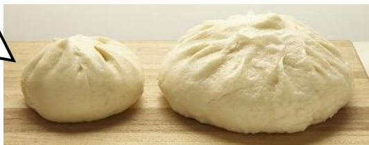
←通常の2,5倍のボリューム肉まん。特大サイズでご用意しました!〈神楽坂 五十番〉ギガ肉まん1,080円