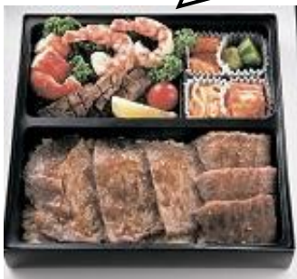
特選ロース&特選カルビをご飯の上に。吟味した素材をご賞味ください。〈叙々苑〉游玄10,800円(2日前要予約)