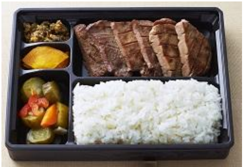
1頭から6枚しかとれない厚切り牛タンステーキと薄切り牛タンのセット(牛たんかねざき)牛タン食べ比べ弁当1,780円