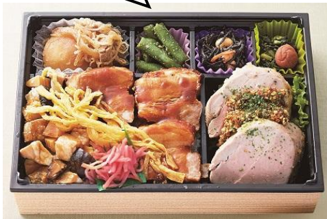
厚い豚ヒレや豚あぶり、豚のあられ煮などバラエティ豊かな肉料理が詰まっています。〈兔びす Daikoku〉豚づくし弁当1,650円