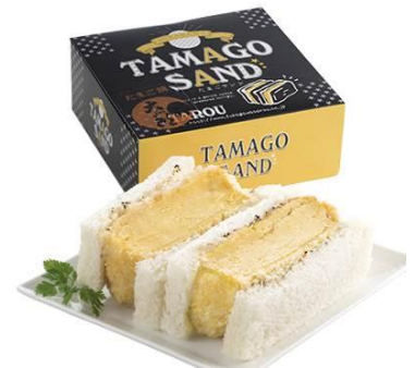
エントリーNO. 3 〈太郎〉

ヒレカツサンド 900円 とんかつ店の老舗〈井泉〉は、カツサンドの発祥のお店！！