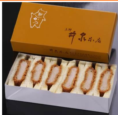
エントリーNO. 2 〈井泉〉

ズワイの脚棒肉、丸ズワイの爪肉、本タラバ、の3種類のかにの味覚が楽しめる、かに寿司専門店の贅沢なサンド。