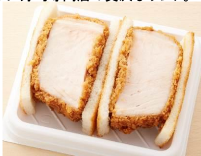
エントリーNO. 4 〈肉卸小島〉 肉卸の〈豚〉カツサンド 1,188円

玉かつサンド 690円 特性ソースで味付けした出汁巻き玉子は、パンと相性抜群！玉子焼き専門店が作るサンドです！