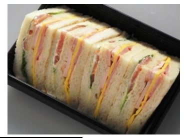
エントリーNO. 6 〈ホテルオークラ〉

具だくさん三度(ミックス) 486円 ボリューム満点！SNS映えする、フォトジェニックなサンドイッチ。