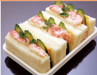
エントリーNO. 1 〈札幌かに家〉 味くらべサンド 980円

松坂屋上野店では、「人気パングランプリ」を開催。サンドイッチ、菓子パン、食事パン、惣菜パンの各部門ごとにエントリーショップから1商品ずつエントリーがなされ、人気投票(※)により各部門ごとにグランプリを決定します。なかでも、注目なのが「サンドイッチ部門」。実は、ベーカリーショップだけでなく、かに寿司専門店、玉子焼き専門店、肉専門店など多彩なショップからその特色を活かしたサンドイッチが発売されています。趣向を凝らした、ユニークなサンドイッチを全制覇してみては？！ (※)エントリーショップにて200円以上お買い上げの方に投票用紙をお渡しします。