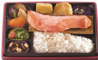
〈ゑびすDaikoku〉サーモン藻塩焼御膳1,180円