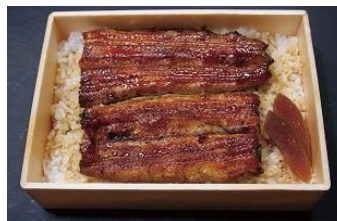
〈日本橋伊勢定〉鰻弁当(中)3,888円