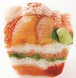
〈創作鮭処タキモト〉贅沢ミルフィュー1,728円