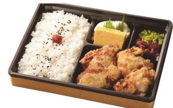
〈たまひでからっ鳥〉和みカラット弁当950円