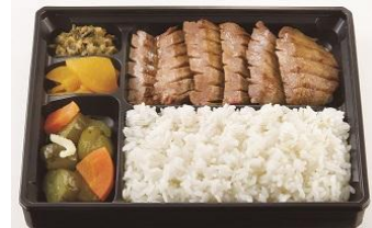
〈牛たんかねざき〉厚切り牛タンステーキ弁当2,000円