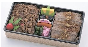
〈味の梅ばち〉米沢牛・ステーキ&すき焼き弁当2,160円