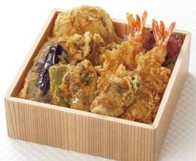
〈銀座天一〉天丼弁当(松)1,134円