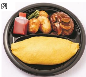
〈洋食や三代目たいめいけん〉オムライス&ハンバーグ1,400円