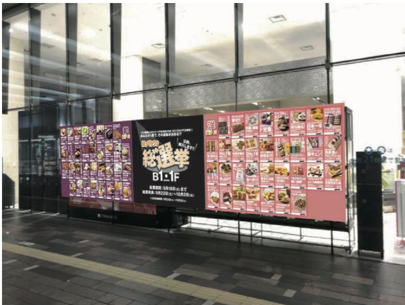
選挙ポスター掲示している店頭の様子。

東京駅隣接という立地にある大丸東京店は出張や旅行のお客さまが多く、1階に50ブランドもの和洋菓子の売り場を配置して「東京みやげ～手土産」を販売。また地階は全長60メートル、年間延べ1000種類、一日1万食を売り上げる「お弁当ストリート」や「お肉の細道」、など約110ブランドを擁する食品売り場になっています。ほっぺタウンーの東京みやげ「手土産プレゼン党」、とほっぺタウンーのお弁当・お惣菜「おべん党」がそれぞれのお客さまからの投票で人気を競う「ほっぺタウン総選挙」を開催します。会期中は113ブランドが立候補し、公約を掲げて人気を競い合います。当選発表は9月25日。