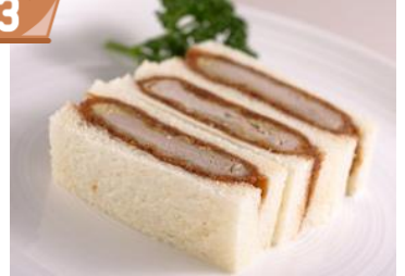
〈とんかつ まい泉〉 ヒレかつサンド(6切入)842円