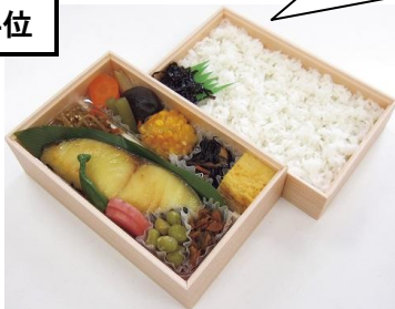
〈味の浜藤〉 銀だら西京焼弁当1,890円