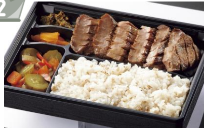
〈牛たん かねざき〉 厚切り牛たんステーキ弁当2,000円