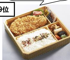
〈とんかつ まい泉〉 たっぷりロースかつ弁当993円