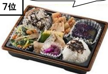
〈おかず本舗 佃浅〉 3品チョイス弁当691円