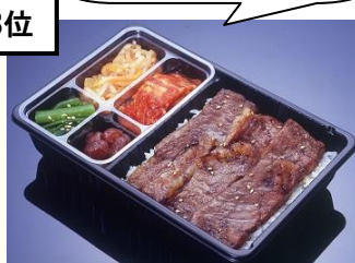
〈叙々苑〉 カルビ弁当2,700円