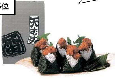
〈地雷也〉 天むす(5個入)680円