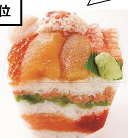
〈創作鮭処 タキモト〉 贅沢ミルフィーユ1,728円