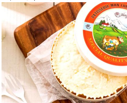
フランス産「フランス・キリ社」のクリームチーズと「堂島ロール」のクリームが軽やかなマリアージュ。〈ベビー モンシェール〉 白いフロマージュ1,188円/1階

毎月5日はチーズケーキの日！昔の日本で食べられていたチーズのような乳製品のことを「醍醐」と呼んでいたことから、とある会社が毎月5日を「チーズケーキの日」と制定し記念日となりました。そこで大丸東京店にあるチーズケーキ約30種の中から、バイクドチーズケーキやフロマージュなど特におすすめのチーズケーキをご紹介します！