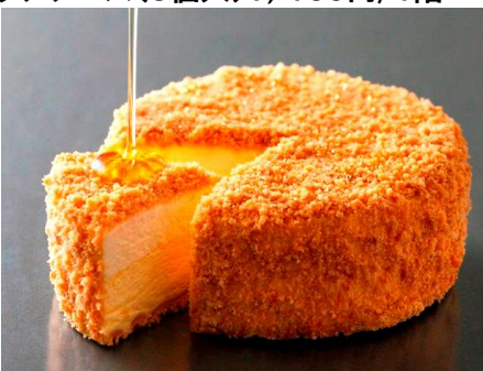
2種類のチーズが重なった贅沢なコントラスト。さりげない金粉が華やかさを演出した人気の一品。〈アンリ・シャルパンティエ〉Wチーズケーキ1,296円/地階