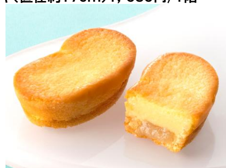
クリームチーズとミルクチーズのケーキを2段に重ねて、バナナジャムをとじこめました。〈東京ばな奈STUDIO〉東京ばな奈チーズケーキ、「見つけたっ」(8個入)1,080円/1階