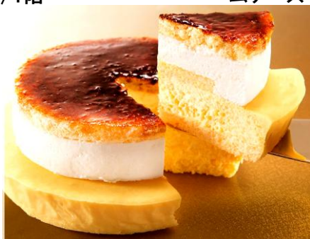
濃厚なバイクドチーズに、フロマージュブラン入りチーズムースを重ねて。〈銀のぶどう〉ブリュレ・チーズケーキ1,296円/1階