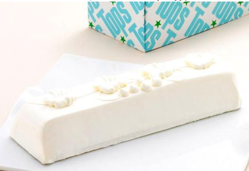
デンマーク産のクリームチーズを使った、コクのあるハードタイプのケーキです。〈赤坂トッパス〉チーズケーキ(6~8人用)2,430円/1階