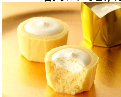
さわやかな酸味とコクのあるチーズを加えたなめらかな生地の上に、濃厚なクリームチーズを重ねました。〈フェスティパロ〉リッチチーズ(5個入)1,100円/1階