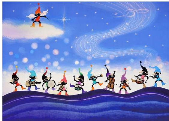
こびとのドレミファソラシド(24.8×35)10,800円