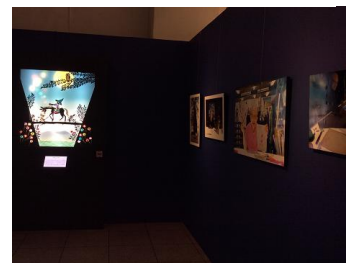
原画展示イメージ