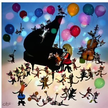
猫と少女の音楽界(27.5×27.5)86,400円