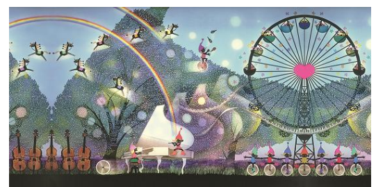
風の中の白いピアノ(60×30)237,600円