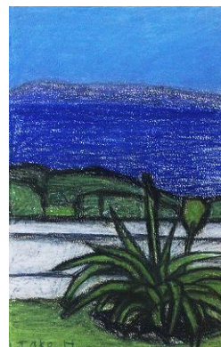
林武「川奈風景」(パステル画) 最低入札価格(税込)38万円～