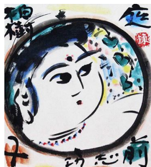
棟方志功「庭前柏樹子妃図」(日本画) 最低入札価格(税込)550万円～