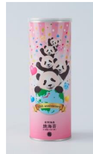
→〈泉屋〉ハッピーパンダ (28枚入)1,404円/1階 ※500個限り