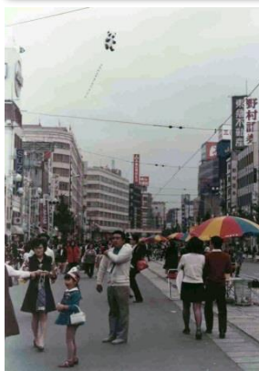
50年前のアドバルーン