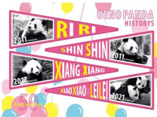
←③リーリー、シンシン、シャンシャン、シャオシャオ、レイレイ ver. 【対象売場】地下1階・1階食品、各階喫茶・レストラン ※1階〈ゴンチャ〉、地下1階・1階ほっぺタウン期間限定ショップは除く