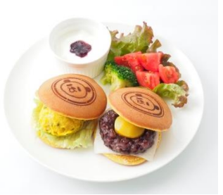
↑〈パンダ茶房 by 銀座清月堂〉 (左)パンダどら焼きプレート(1食)1,320円、 (右)パンダマロンパフェ(1杯)1,430円/中2階