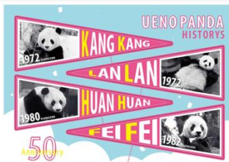
←①カンカン、ランラン、ホアンホアン、フェイフェイ ver. 【対象売場】1・2階化粧品、中2階リビング雑貨、6階食器・調理用品 ※6階催事場は除く

※レシート合算不可。 ※対象売場ごとにお配りするステッカーの種類が異なります。 ※数量限定につき、なくなり次第終了。 ※転売は固くお断りいたします。