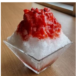
かき氷 イチゴミルク 950円