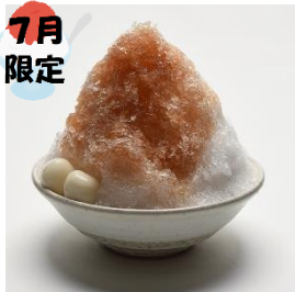
7月限定 氷大納言あずき 750円