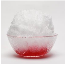
氷イチゴ・すい 580円

昔ながらの粗めの氷と純氷にこだわった夏の定番メニューのかき氷は、幅広い年代のお客様に人気！トッピングも豊富にご用意し、お好みに合わせてカスタマイズできます。