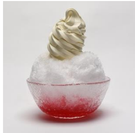
氷クリーム(イチゴ・すい) 720円