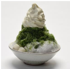
氷クリーム(宇治金時) 960円