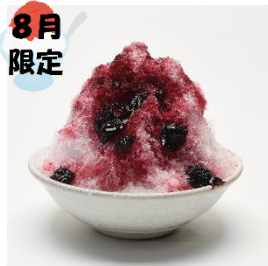
8月限定 氷ブルーベリー 750円