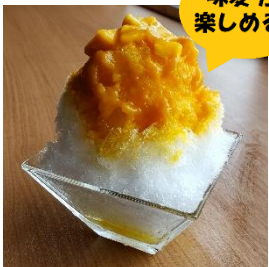
かき氷 マンゴーレモン 950円