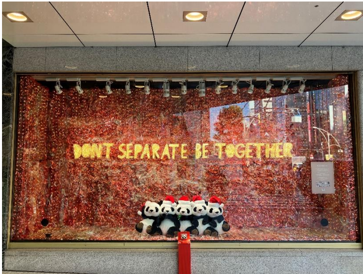
1階北口ショーウィンドウ

(※) 本来であれば捨てられるはずの廃棄物に新たな付加価値を持たせることで、別の新しい製品にアップグレードして生まれ変わらせること。