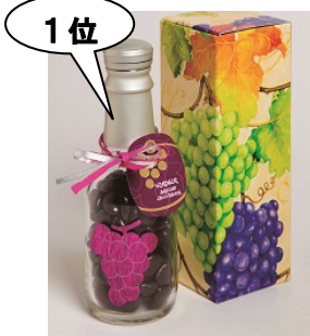
1位 ＜ヴェルディエ＞ レザンドレ・オ・ソートルヌ“貴腐” ミニボトル (95g)1,944円/地階