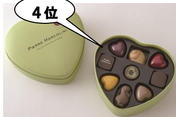
4位 ＜ピエール マルコリーニ＞ ホワイトデー セレクション (9個入り)3,564円

3月1日(水)～3月14日(火)の間、1階和洋菓子売場にて、本当に欲しいホワイトデースイーツランキングの商品をランキング形式で展示します！