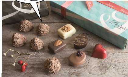
5位 ＜デジレー＞ショコラ&トリュフ (10個入り)1,890円