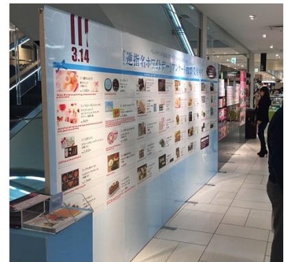
↑バレンタイン会場にて実施したアンケートパネル

ホワイトデーマーケットは年々盛り上がり、大丸東京店の売上でもこの3年間で10.9%アップしています。更に、3年ぶりの平日のバレンタインとなった2017年、義理チョコ需要が増加した分、ホワイトデーも昨年より盛り上がる事が予想されます。2017年2月1日(水)から2月14日(火)に11階バレンタイン会場でホワイトデーのお返しに欲しいスイーツを選んでいただき、女性1,152名から回答を得ました。女性が選ぶホワイトデーに欲しいスイーツ結果を発表します。