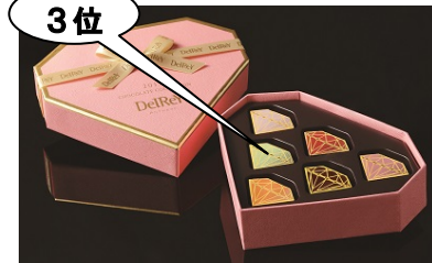
3位 ＜デルレイ＞ ダイヤモンドBOX(6個入り) 3,564円/地階

3月1日(水)～3月14日(火)の間、1階和洋菓子売場にて、本当に欲しいホワイトデースイーツランキングの商品をランキング形式で展示します！