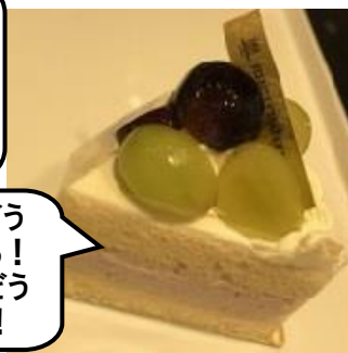
〈アンリ・シャルパンティエ〉 シャインマスカットと巨峰のショートケーキ (1個)670円