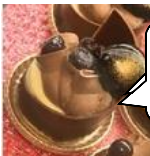
〈アンテノール〉 フォレノワール・モデルヌ (1個)864円

9月29日(金)は洋菓子の日！大丸東京店では兵庫県産の丹波栗や北海道産えびすかぼちゃなど、秋の旬を贅沢に使用したスイーツが続々と登場しています。いつもがんばっている自分へのご褒美やお土産にぴったりです！今回はそんな心もお腹も満たしてくれるスイーツをご紹介します！