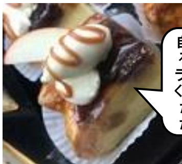
〈キースマンハッタン〉 キャラメルアップルパイ (1個)540円