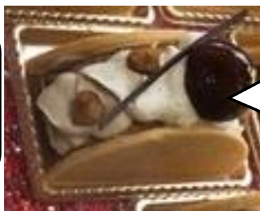
〈アンテノール〉 モンブラン・ヌーポー (1個)810円