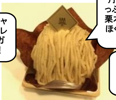
〈アンリ・シャルパンティエ〉 和栗のモンブラン(1個)594円