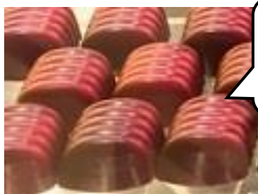
〈ヴィタメール〉 ヴァン・ショー(1個)313円