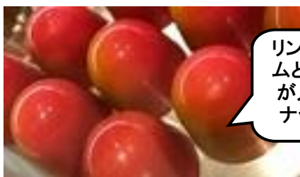
〈ヴィタメール〉 ポムルージュ(1個)314円