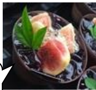
〈キース・マンハッタン〉 いちじくのデザート (1個)594円