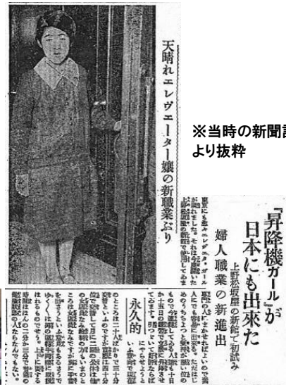
※当時の新聞記事より抜粋

改修や自動化はされているものの、エレベーターは昇降機ガールが登場した当時と同じものです！