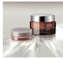
〈ハウス オブ オーゼ〉 ※中2階より移設