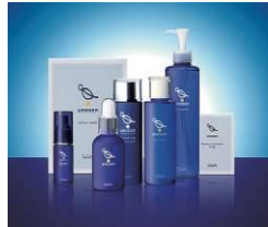
〈水素ラウンジ バッサ〉