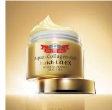
〈ドクターシーラボ〉