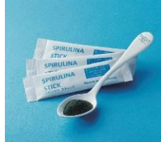
〈スピリリナブルー〉