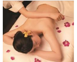
〈クイーンズウェイ〉