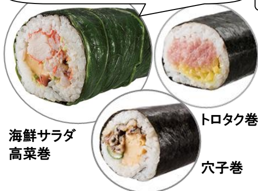
海鮮サラダ 高菜巻