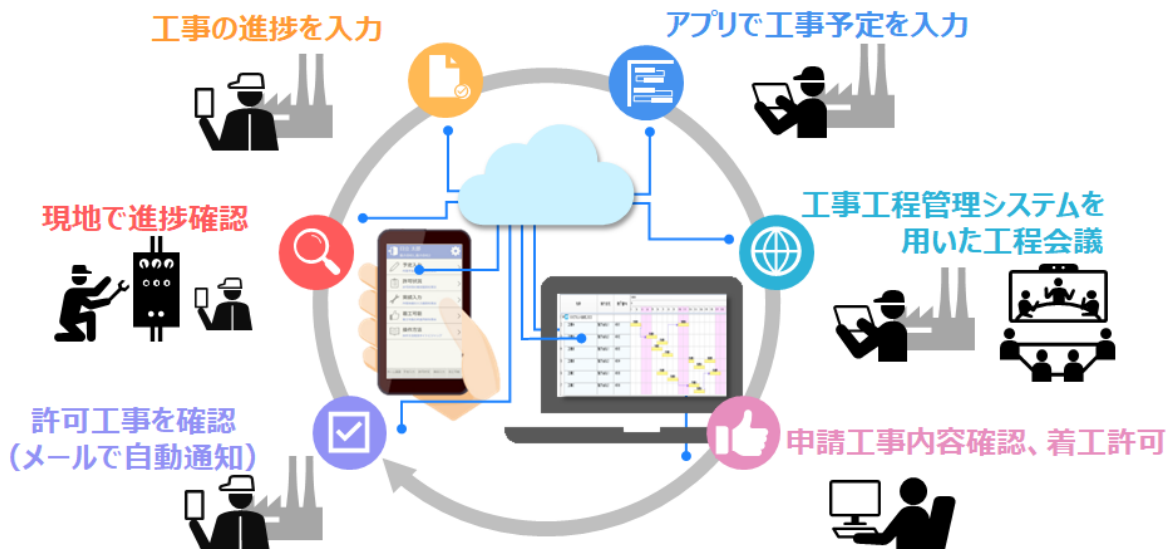
図：プラント向け予防保全 進捗管理サービスの概要イメージ

日立ソリューションズは三菱ケミカルの戦略パートナーの1社として、DXと協創を一層促進しています。今後、化学や薬品、エネルギー業界の事業を支えるプラントの修繕業務の生産性向上を「プラント向け予防保全 進捗管理サービス」の提供を通じて支援し、社会のサステナビリティ・トランスフォーメーション（SX）の実現に貢献していきます。