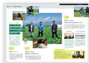
国内グループ会社の 取り組み