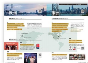
海外グループ会社の 取り組み