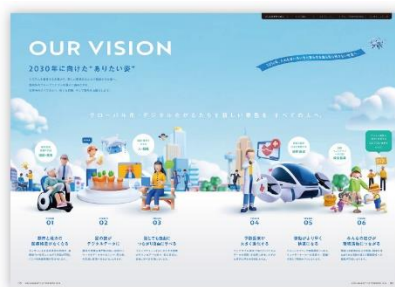
2030年に向けたビジョン