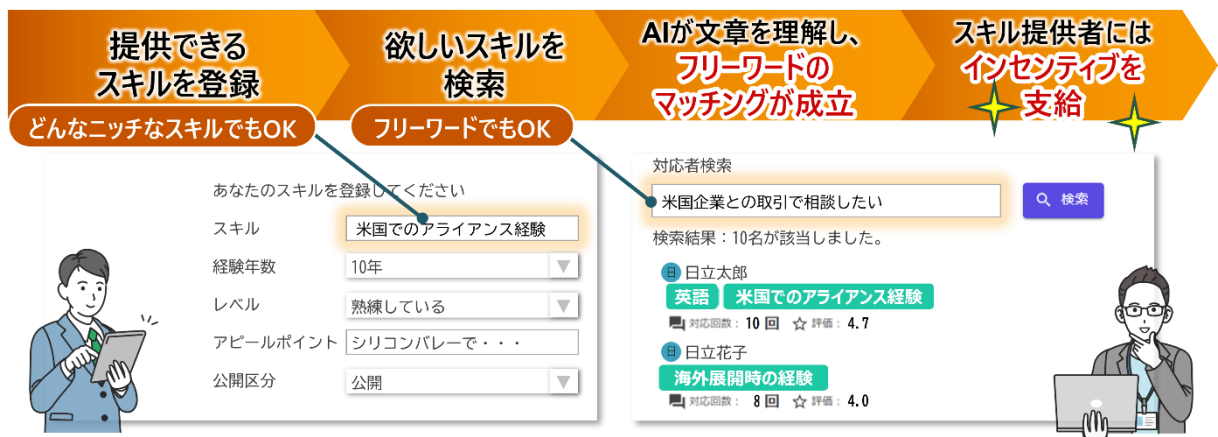
図：本サービスが実現する、スキルマッチングのイメージ

日立ソリューションズは、2024年9月から半年間、全社員で本サービスの検証を行い、企業側の管理や社員側の利便性を確認しました。成立した副業依頼では、新規事業の企画や製品開発へのナレッジ共有などが行われました。今後はさらに副業内容を社内に公開して募集する形式への対応などサービス拡充を続けます。日立ソリューションズは、人財活用の全体最適につながる本サービスの提供を通じ、企業や社会のSX実現に貢献していきます。