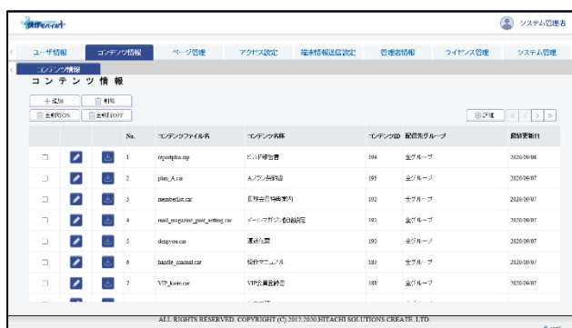
▲端末・ユーザー管理画面