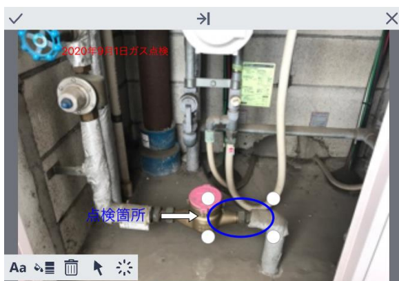
▲モバイル端末画面(手書き機能)