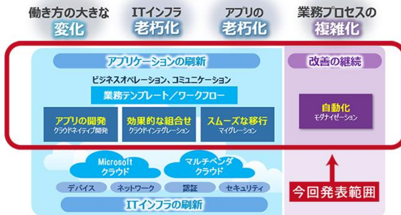
図3 IT モダナイゼーション支援の全体像