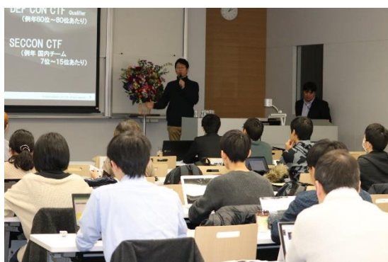
ハッキング体験 ワークショップの様子

また締結を記念し、学生向けハッキング体験ワークショップやパネルディスカッションを交えた2部構成のシンポジウム「情報セキュリティ vs AI ～未来の脅威を読み解く～」をサイバーセキュリティの日である、2月3日に共同開催しました。