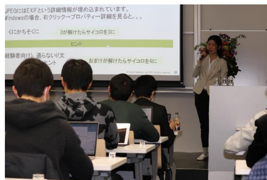
ハッキング体験で説明する青山