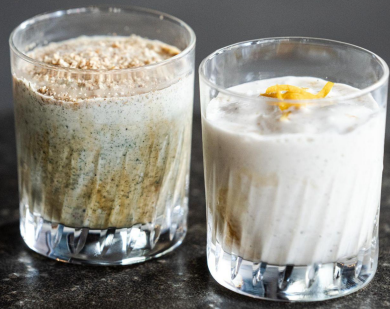
左：よもぎ 右：白味噌

「スタンプタウン コーヒーロースターズ」の夏季限定新メニュー白味噌とよもぎのシェイクは、バニラアイスとスタンプタウンこだわりのエスプレッソ、そして牛乳をベースに国産のよもぎと京都産の白味噌を使用したまろやかなオリジナルシェイクです。白味噌シェイクは京都産白味噌の優しい甘味とエスプレッソのほろ苦さが旨味を際立たせ、よもぎシェイクは国産よもぎの香ばしさとココが楽しめる一杯です。