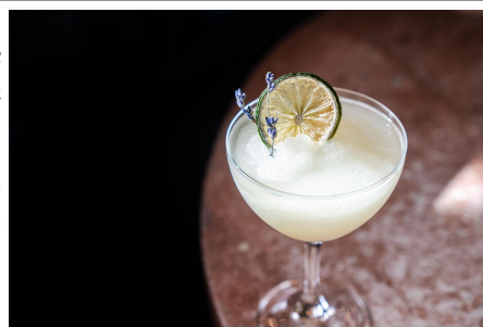
フローズンマルガリータ：1,300円

エースホテル京都は2022年6月11日に開業2周年を迎えます。日頃のご愛顧に感謝の気持ちを込めて6月の毎週末、2泊目が無料宿泊になる特別プランを期間限定でご用意致しました。また同プランと同じ対象日限定で、ホテル2階のバー&タコスラウンジの「ピオピコ」ではペアでご来店いただいた方に、2杯目のフローズンマルガリータを無料で提供します。パートナーや友人がフローズンマルガリータを注文すると、もう一人のパートナーや友人が無料でフローズンマルガリータを飲むことができます。また、3階のミスター・モーリスズイタリアンでは6月11日（土） 12日（日）週末限定で「2周年記念コース」を注文された方にグラスワインを200円で提供いたします。