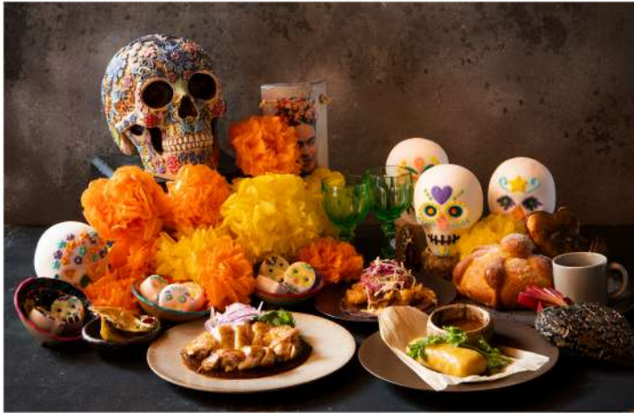
死者の日～Day of the Dead～