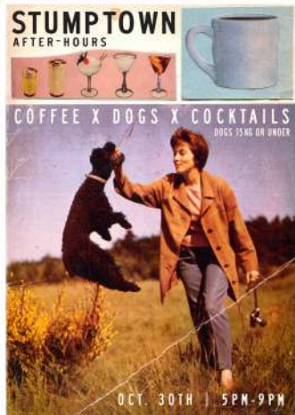
スタンプタウン アフターアワーズ

毎年恒例メキシコのお盆「死者の日～Day of the Dead～」をはじめ、 愛犬と一緒にカクテルタイムを楽しむ「スタンプタウン アフターアワーズ」 など、 晩秋のイベントが続々と開催決定！