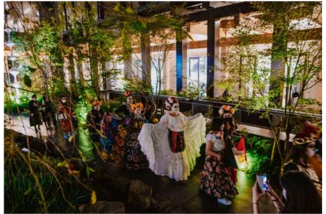
写真は昨年2021年の様子