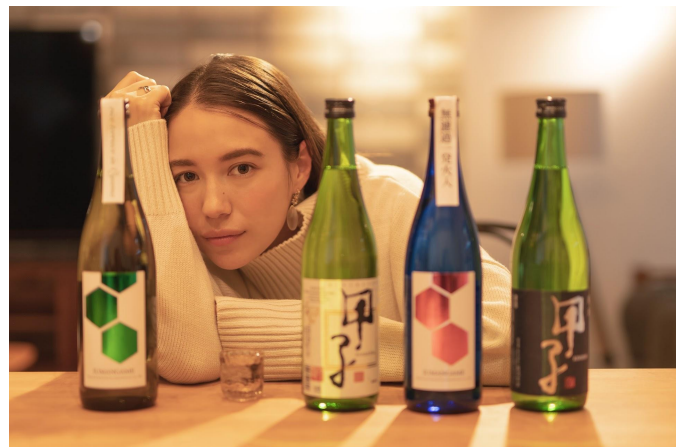
PERIE Online コラボ企画