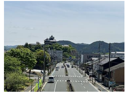
【福知山城のそばまで走れるコース】

京都府福知山市などで構成する福知山マラソン実行委員会は、「第32回福知山マラソン」を2024年11月23日(土・祝)に開催します。