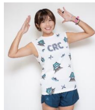
きゃっするひとみーさん