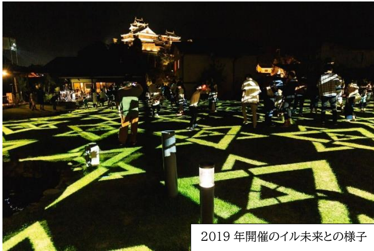
2019年開催のイル未来との様子

期間 2024年 10月 19日(土)、20日(日) 会場 福知山城公園、ゆらのガーデン