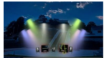
ストリートピアノイメージ

使われなくなったピアノを活用し、福知山城の正面にストリートピアノを設置します。お城を背景にピアノ演奏をお楽しみください。