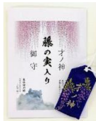
藤の実入りお守り