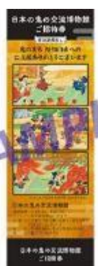
日本の鬼の交流博物館チケット

【問】福知山市役所 秘書広報課 シティプロモーション係 TEL.0773-24-7090