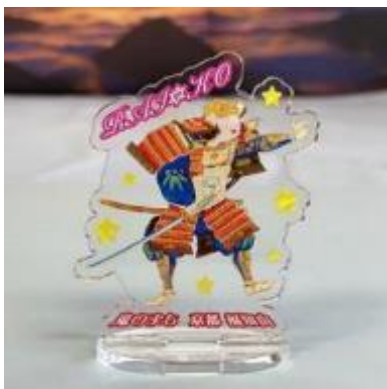
特製アクリルスタンド(源頼光)