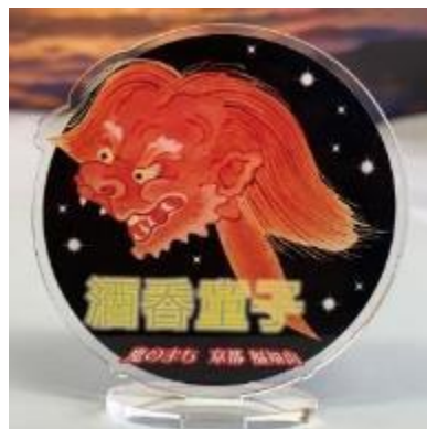
特製アクリルスタンド(酒呑童子)