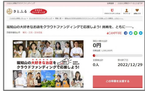
寄附受付ページ(さとふる HP より)

京都府福知山市は、新商品の開発やブラッシュアップを目指すお店を支援するため、「食を通じた観光促進事業」を実施しています。2023年も継続して取り組み、福知山の食の魅力さをさらに魅力的なものにしていくため、お店の挑戦を後押しするクラウドファンディング型ふるさと納税を、10月3日(月)から受付開始します。参加事業者は、トマト農家や日本茶専門店、精肉店など、福知山市内で「食」に関する挑戦を行う全9店です。