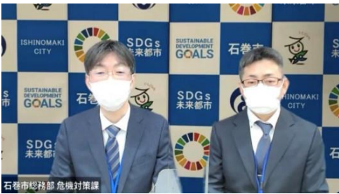
(宮城県石巻市職員へのインタビュー動画) 3月6日(日)配信予定

福知山市公式 Youtube チャンネル→ https://www.youtube.com/c/福知山市公式動画チャンネル