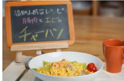
(備蓄食を使ったアレンジ調理動画) 3月11日(金)配信予定