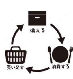
ローリングストック (食品ロスに配慮した備蓄法)