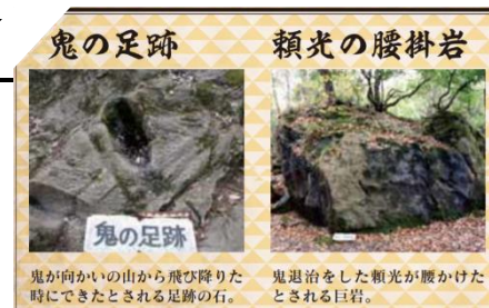
鬼が向かいの山から飛び降りた時にできたと思われる足跡の石。

https://www.city.fukuchiyama.lg.jp/site/promotion/onipamf.html