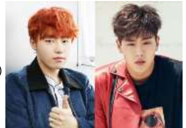
「Power of K」JMC ユグオン(Block.B)、シヨヌ(MONSTA X)

「Kchan！韓流TV」では、K-POPアイドル中心の番組に力を入れ、オリジナル番組も充実！ソウル収録の新音楽番組「Power of K」や平日のレギュラー番組として、ジュノ&ギュミン(from BEE SHUFFLE)出演「JGのハルハルTV」を月～金でベルト編成するほか、今後ブレイク必至のアイドルたちの密着独占番組などをお届けする予定です。