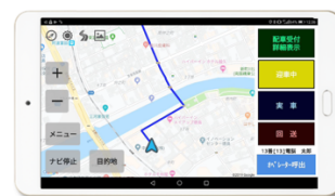
ドライバー操作用タブレット

電脳交通の配車システムは、配車室オペレーター操作の「電脳配車 OS」とドライバー操作の車載タブレット「電脳タブレット」によって構成されています。別途電話回線を準備すること無く IP 通話機能を通じてオペレーターとドライバーの通話も可能です。