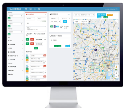
配車室オペレーター用PC