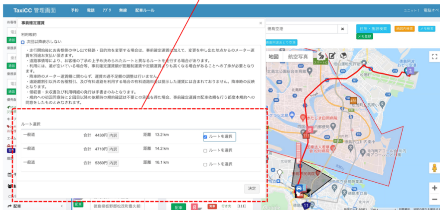
目的地までの距離・料金・ルートを表示（距離によっては1ルートのみ、有料道路の場合別途記載あり）

タクシー事業者は、通常のタクシー配車業務で使用している電腦交通のシステム内で事前確定運賃サービスの受付とドライバーへの配車指示が行えます。