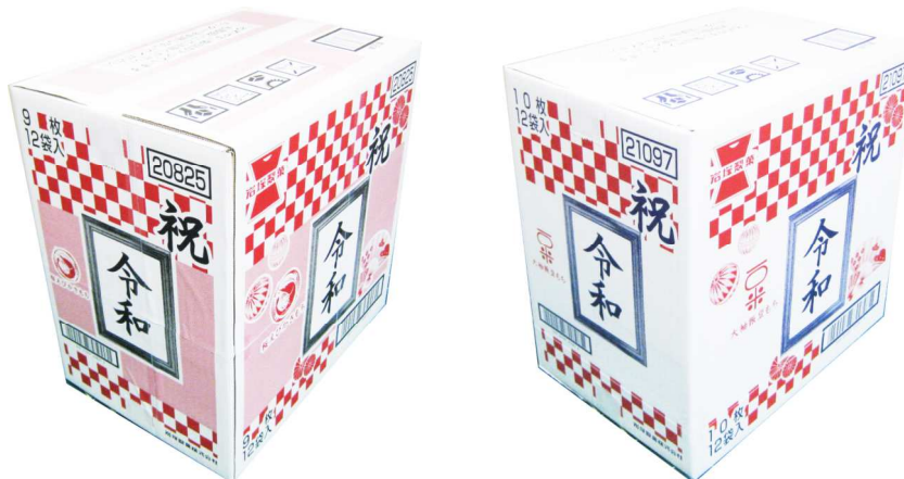
▲商品梱包段ボール箱