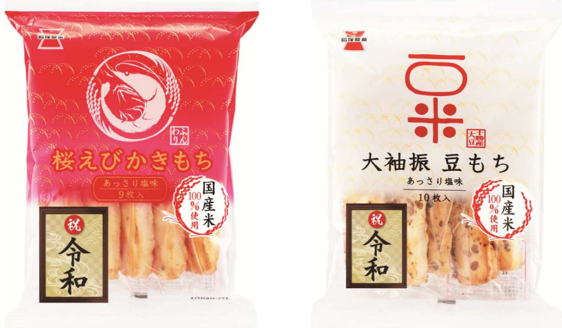
▲新年号「令和」シールを貼ったパッケージ

※2売場によって「桜えびかきもち」「大袖振豆もち」以外にも「令和」をデザインしたシールを貼ったパッケージになる商品もあります。