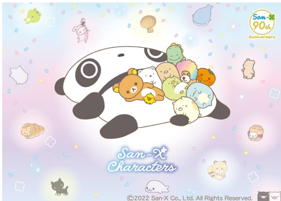
広報用画像① キービジュアル

「たればんだ」、「リラックマ」、「すみっコぐらし」など、力の抜けた癒やし感や、くすっと笑えるシュールさを持ち合わせ、見た目のかわいさだけではなく不思議な魅力に満ちたキャラクターを生み出してきたサンエックス。