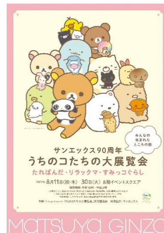
広報用画像③ポスター画像 B