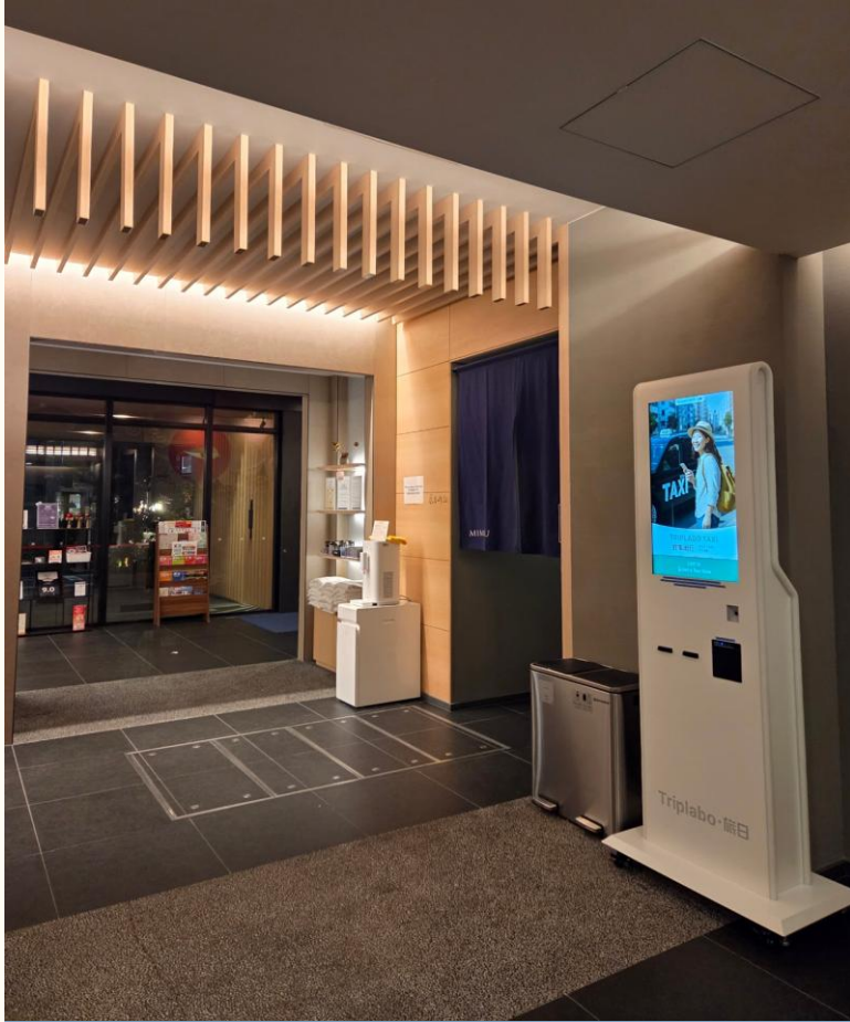
ホテルロビー 設置例