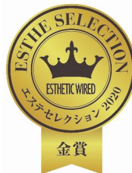
※1 実査委託先:ゼネラルリサーチ

「運命の一着」に出会えるウェディングドレスサロン“DESTINY Line”(デスティニーライン)がプロデュースするビューティケアサロンより、2020年11月1日～12月10日迄『クリスマスコフレ』を数量限定で予約受付開始します。美しさを内から活性化させる「ヒト幹細胞培養液」を高濃度配合したコスメブランド『direia / ディレイア』より、プレ花嫁の結婚式前の願いを叶える【短時間で即効性のあるコスメ】「リバイタル セラム (美容液)」「アンベリティ ザ クリーム (美容クリーム)」「インテンス ユース ローション」「リペアクレンジング」「プラチナム バイオマスク」の《計5点》を限定数特別パッケージ。安全性・テクスチャー・デザイン・効果・エビデンス全てに妥協しないプロデュースのハイクオリティなスキンケア製品をお届けします。また無農薬の国産薔薇を使用したオーガニックコスメなので、使用するたび優雅で上品な香りに包まれます。心躍るクリスマスコフレはご自身のご褒美にもオススメです。(※予約は限定数無くなり次第終了 / ※商品のお渡しは12月25日以降となります)