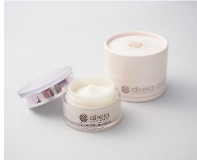
② ステムアンペリティ ザ クリーム (美容クリーム)