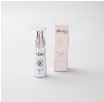
① ステムリバイタ セラム (美容液)