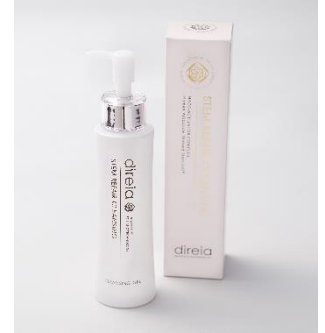
④ ステムリペア クレンジング