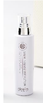
③ ステムインテンス ユースローション