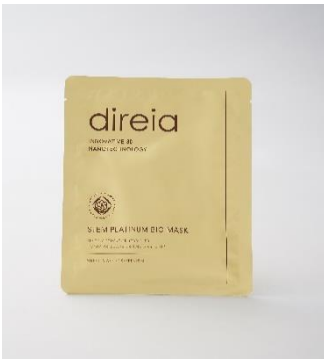
⑤ ステムプラチナム バイオマスク