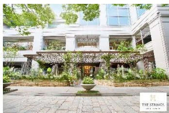
ザ スtrings 表参道 PARK AVENUE 3F

開催日程：7月31日（土）※完全予約制 開催時間：3部制（1部 10:00・2部 13:30・3部17:00） 開催場所：ザ スtrings 表参道 PARK AVENUE 3F 〒107-0061 東京都港区北青山3-6-8 ※ 表参道B5出口地下通路より直結 ( https://www.strings-hotel.jp/omotesando/ ) 来館特典：前撮り・ドライフラワーミニブーケ・ 会場パンフレットその他豪華特典