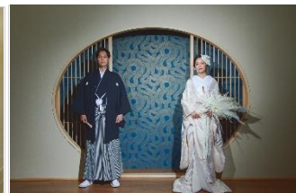
花鳥風月スタジオ

チャペルを彷彿させる階段と大きな窓。実際にチャペルで使用されていた大扉も配備し、圧倒的な没入感でのセレモニーシーンの撮影も可能。照明を活かしてフォトジェニックな1枚に仕上げます。