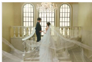
ドラマチックスタジオ

お好みでお選びいただける複数の背景に風船や、カラフルな番傘、花びらや紙吹雪、立ち込める煙+風の動き（モーション）を加えて楽しさと躍動感のあるシーン撮影を。