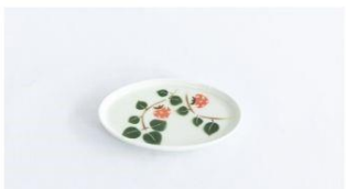
イチゴ楕円小皿 5,500円