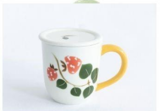
イチゴ紅茶マグB(蓋付) 13,200円