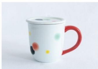
水玉紅茶マグ赤(蓋付) 12,650円