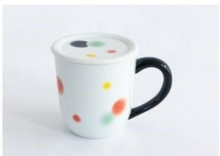
水玉紅茶マグ黒(蓋付) 12,650円