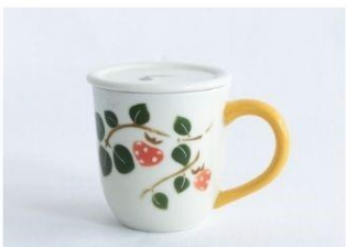
イチゴ紅茶マグA(蓋付) 13,200円