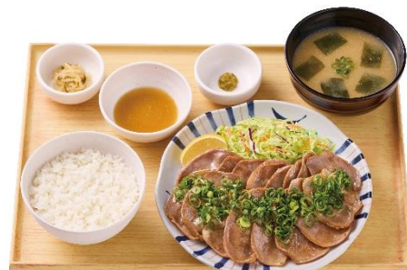
【お肉 2 倍】ネギたっぷり豚タン定食 1,990 円