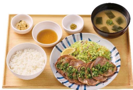
ネギたっぷり豚タン定食 1,250 円