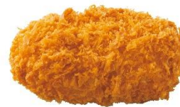
単品惣菜 カニクリームコロッケ 180 円