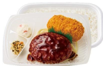
豪華洋食コンビ カニコロ&デミグラス ハンバーグ弁当 820 円