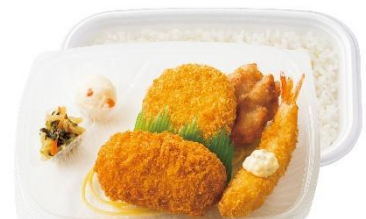
から揚げ・メンチ・エビフライ入り カニコロミックス弁当 690 円