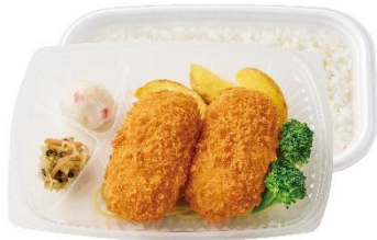
とろ〜り、なめらか カニクリームコロッケ弁当 590 円