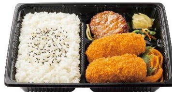
洋食おかず カニコロバラエティ弁当 660 円