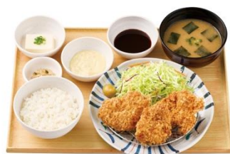
【タルタルソース付】とりカツ定食（3個） 910 円