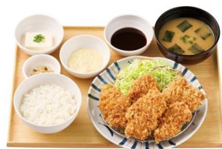
【タルタルソース付】とりカツ定食（5個） 1,200 円