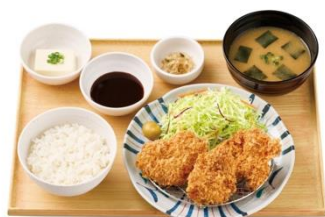
とりカツ定食（3個） 860 円