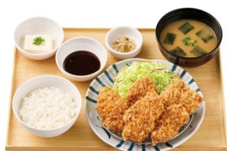
とりカツ定食（5個） 1,150 円