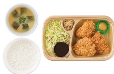
〔テイクアウト〕 とりカツ（3個）ごはん・みそ汁付 860 円