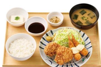
とりカツとエビフライの定食 1,000 円