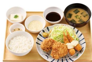
【タルタルソース付】 とりカツとエビフライの定食 1,050 円