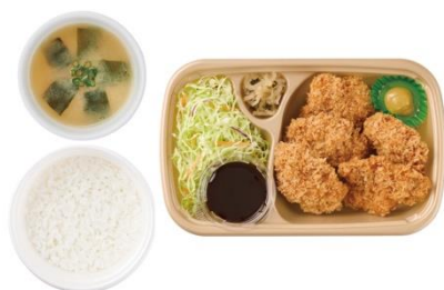
〔テイクアウト〕 とりカツ（5個）ごはん・みそ汁付 1,150 円