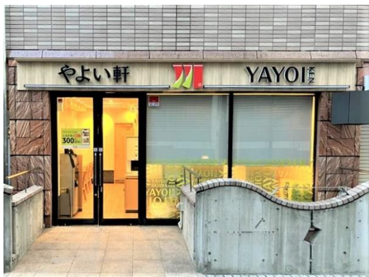
「恵比寿1丁目店」外観