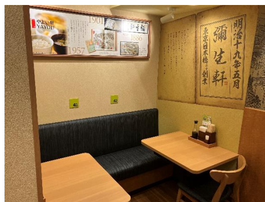
「恵比寿1丁目店」内観